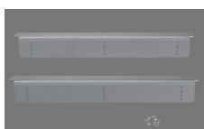
> Weblink 500.000.074.00 / CHF 60.- Set di squadrette di supporto