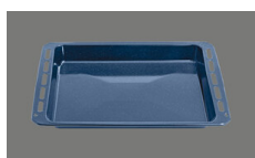
> Weblink 500.000.040.00 / CHF 88.- Teglia extra profonda 50 mm