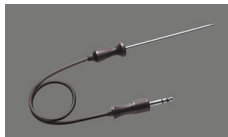
> Weblink 500.000.173.00 / CHF 4.- Sensore di temperatura al cuore