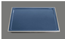
> Weblink 500.000.046.00 / CHF 4.- Divisorio per vano cottura