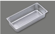
> Weblink 40.000.912.00 / CHF 106.- Vaschetta, forato