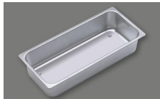
> Weblink 40.001.289.00 / CHF 106.- Vaschetta, non forato