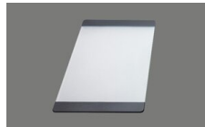
> Weblink 40.000.909.00 / CHF 151.- Tagliere, in vetro, bianco