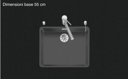
Dimensioni base 55 cm

Montaggio Lavelli a filo top Modello LIO CD 50F/17 Materiale Cristadur N. di articolo 10.105.686.00