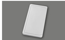
> Weblink 40.001.277.00 / CHF 151.- Tagliere, sintetico