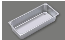
> Weblink 40.001.289.00 / CHF 106.- Vaschetta, non forato