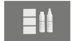
> Weblink 40.001.509.00 / CHF 29.- Kit di pulizia Easy Care per lavelli in granito