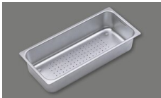
> Weblink 40.000.912.00 / CHF 106.- Vaschetta, forato