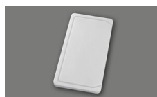
> Weblink 40.001.277.00 / CHF 151.- Tagliere, sintetico