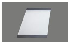
> Weblink 40.000.909.00 / CHF 151.- Tagliere, in vetro, bianco