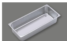
> Weblink 40.001.289.00 / CHF 106.- Vaschetta, non forato