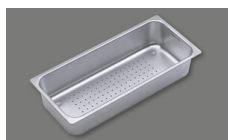
> Weblink 40.000.912.00 / CHF 106.- Vaschetta, forato