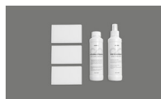
> Weblink 40.001.509.00 / CHF 29.- Kit di pulizia Easy Care per lavelli in granito