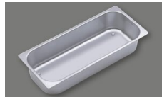
> Weblink 40.001.290.00 / CHF 106.- Vaschetta, non forato