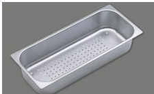
> Weblink 40.000.914.00 / CHF 106.- Vaschetta, forato