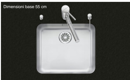
Dimensioni base 55 cm