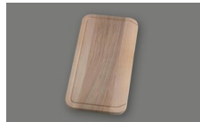
> Weblink 40.001.147.00 / CHF 151.- Tagliere, in legno