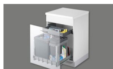
> Weblink 40.001.024.00 / CHF 427.- Müllex Boxx 55/60-R Bio