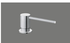
> Weblink 40.001.314.00 / CHF 155.- Distributore Nano