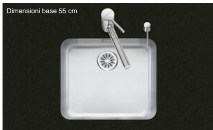
Dimensioni base 55 cm