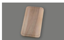
> Weblink 40.001.147.00 / CHF 151.- Tagliere, in legno