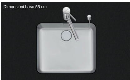
Dimensioni base 55 cm

Montaggio Lavelli sottopiano Modello V 50-42U Materiale Acciaio inox 18/10 N. di articolo 10.105.206.00