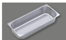
> Weblink 40.001.290.00 / CHF 106.- Vaschetta, non forato