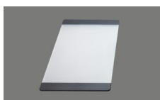
> Weblink 40.000.915.00 / CHF 151.- Tagliere, in vetro, bianco