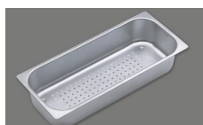
> Weblink 40.000.914.00 / CHF 106.- Vaschetta, forato