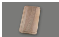
> Weblink 40.001.147.00 / CHF 151.- Tagliere, in legno