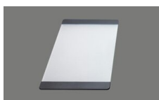
> Weblink 40.000.915.00 / CHF 151.- Tagliere, in vetro, bianco