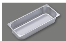
> Weblink 40.001.290.00 / CHF 106.- Vaschetta, non forato