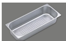
> Weblink 40.000.914.00 / CHF 106.- Vaschetta, forato