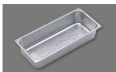
> Weblink 40.000.912.00 / CHF 106.- Resteschale, gelocht