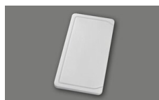
> Weblink 40.001.277.00 / CHF 151.- Schneidebrett, aus Kunststoff