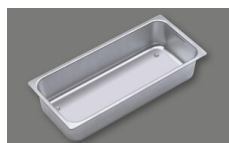
> Weblink 40.001.289.00 / CHF 106.- Resteschale, ungelocht