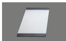
> Weblink 40.000.909.00 / CHF 151.- Schneidebrett, aus Glas, weiss