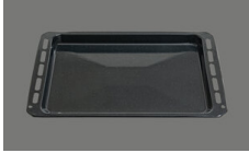
> Weblink 500.000.112.00 / CHF 4.- Universablech 30 mm