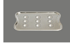
> Weblink 500.000.118.00 / CHF 4.- Garbehältereinlage, geloht