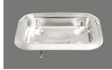
> Weblink 500.000.116.00 / CHF 4.- Garbehälter