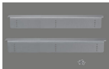
> Weblink 500.000.074.00 / CHF 60.- Auflagewinkel-Set