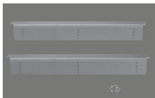
> Weblink 500.000.074.00 / CHF 60.- Auflagewinkel-Set