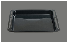
> Weblink 500.000.115.00 / CHF 96.- Extra tiefes Blech 50 mm