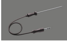
> Weblink 500.000.048.00 / CHF 4.- Kerntemperaturfühler