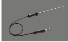
> Weblink 500.000.048.00 / CHF 4.- Kerntemperaturfühler