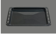
> Weblink 500.000.112.00 / CHF 4.- Universalblech 30 mm