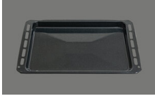
> Weblink 500.000.112.00 / CHF 3.- Universallech 30 mm