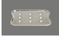
> Weblink 500.000.118.00 / CHF 3.- Garbehältereinlage, gelocht