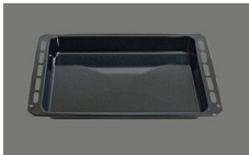
> Weblink 500.000.115.00 / CHF 96.- Extra tiefes Blech 50 mm