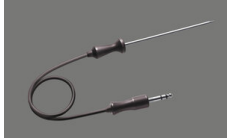
> Weblink 500.000.048.00 / CHF 3.- Kerntemperaturfühler