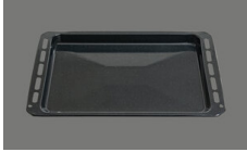
> Weblink 500.000.112.00 / CHF 3.- Universalblech 30 mm