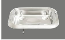
> Weblink 500.000.116.00 / CHF 3.- Garbehälter