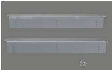
> Weblink 500.000.074.00 / CHF 60.- Auflagewinkel-Set