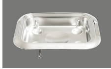
> Weblink 500.000.116.00 / CHF 4.- Garbehälter