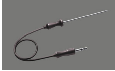
> Weblink 500.000.173.00 / CHF 4.- Kerntemperaturfühler