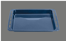
> Weblink 500.000.040.00 / CHF 88.- Extra tiefes Blech 50 mm