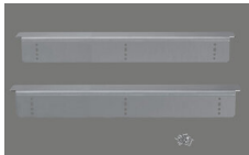
> Weblink 500.000.074.00 / CHF 60.- Auflagewinkel-Set