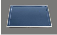
> Weblink 500.000.046.00 / CHF 4.- Garraumteiler