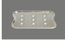
> Weblink 500.000.118.00 / CHF 4.- Garbehältereinlage, geloht