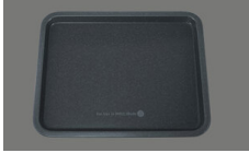
> Weblink 500.000.041.00 / CHF 1.- Keramikeinsatz