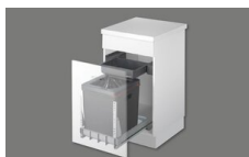
> Weblink 40.001.023.00 / CHF 347.- Müllex Boxx 40-R