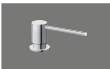
> Weblink 40.001.314.00 / CHF 155.- Dispenser Nano