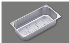
> Weblink 40.000.971.00 / CHF 106.- Resteschale, gelocht