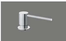
> Weblink 40.001.314.00 / CHF 155.- Dispenser Nano