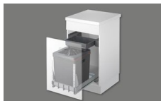
> Weblink 40.001.023.00 / CHF 347.- Müllex Boxx 40-R