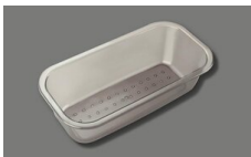
> Weblink 40.001.004.00 / CHF 42.- Resteschale, gelocht