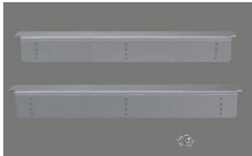
> Weblink 500.000.074.00 / CHF 60.- Auflagewinkel-Set