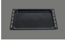
> Weblink 500.000.119.00 / CHF 2.- Backblech 20 mm