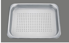
> Weblink 500.000.047.00 / CHF 2.- Garbehälter, gelocht