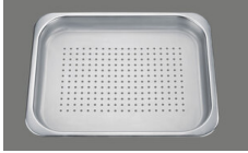
> Weblink 500.000.047.00 / CHF 3.- Garbehälter, gelocht