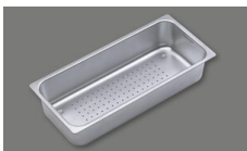
> Weblink 40.000.912.00 / CHF 106.- Resteschale, gelocht