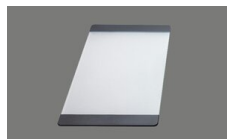
> Weblink 40.000.909.00 / CHF 151.- Schneidebrett, aus Glas, weiss