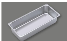
> Weblink 40.001.289.00 / CHF 106.- Resteschale, ungelocht