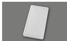
> Weblink 40.001.277.00 / CHF 151.- Schneidebrett, aus Kunststoff