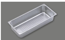
> Weblink 40.000.912.00 / CHF 106.- Resteschale, gelocht