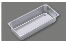
> Weblink 40.001.289.00 / CHF 106.- Resteschale, ungelocht