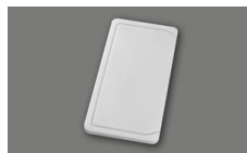
> Weblink 40.001.277.00 / CHF 151.- Schneidebrett, aus Kunststoff