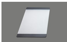
> Weblink 40.000.909.00 / CHF 151.- Schneidebrett, aus Glas, weiss