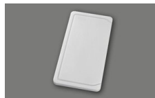
> Weblink 40.001.277.00 / CHF 151.- Schneidebrett, aus Kunststoff