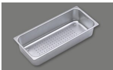
> Weblink 40.000.912.00 / CHF 106.- Resteschale, gelocht