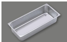
> Weblink 40.001.289.00 / CHF 106.- Resteschale, ungelocht