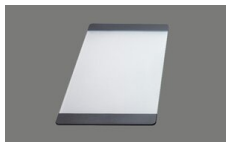
> Weblink 40.000.909.00 / CHF 151.- Schneidebrett, aus Glas, weiss