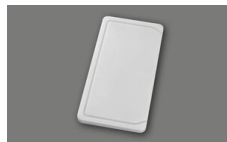
> Weblink 40.001.277.00 / CHF 151.- Schneidebrett, aus Kunststoff