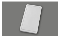
> Weblink 40.001.277.00 / CHF 151.- Schneidebrett, aus Kunststoff