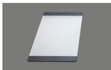
> Weblink 40.000.909.00 / CHF 151.- Schneidebrett, aus Glas, weiss