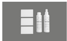
> Weblink 40.001.509.00 / CHF 29.- Reinigungsset Easy Care für Granitspülen