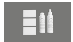
> Weblink 40.001.509.00 / CHF 29.- Reinigungsset Easy Care für Granitspülen