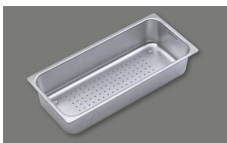
> Weblink 40.000.912.00 / CHF 106.- Resteschale, gelocht