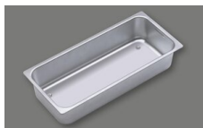
> Weblink 40.001.289.00 / CHF 106.- Resteschale, ungelocht