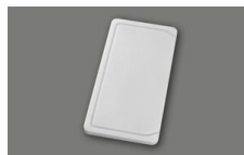
> Weblink 40.001.277.00 / CHF 151.- Schneidebrett, aus Kunststoff