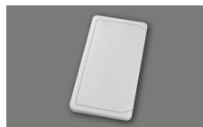
> Weblink 40.001.277.00 / CHF 151.- Schneidebrett, aus Kunststoff