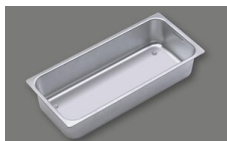
> Weblink 40.001.289.00 / CHF 106.- Resteschale, ungelocht