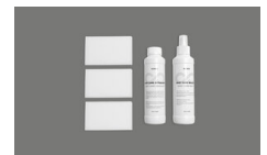
> Weblink 40.001.509.00 / CHF 29.- Reinigungsset Easy Care für Granitspülen