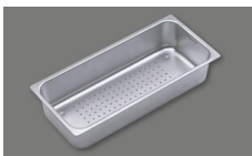
> Weblink 40.000.912.00 / CHF 106.- Resteschale, gelocht