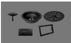
> Weblink 40.002.560.00 / CHF 319.- 3 1/2" Raumsparventil, Typ S | Schwarz matt