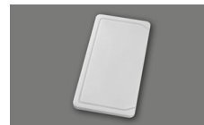
> Weblink 40.001.277.00 / CHF 151.- Schneidebrett, aus Kunststoff