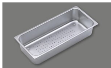
> Weblink 40.000.912.00 / CHF 106.- Resteschale, gelocht