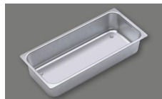
> Weblink 40.001.289.00 / CHF 106.- Resteschale, ungelocht