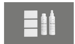
> Weblink 40.001.509.00 / CHF 29.- Reinigungsset Easy Care für Granitspülen