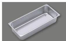
> Weblink 40.001.289.00 / CHF 106.- Resteschale, ungelocht