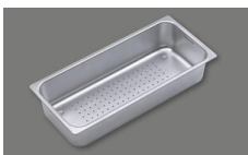
> Weblink 40.000.912.00 / CHF 106.- Resteschale, gelocht