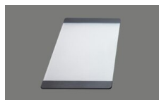
> Weblink 40.000.909.00 / CHF 151.- Schneidebrett, aus Glas, weiss