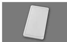
> Weblink 40.001.277.00 / CHF 151.- Schneidebrett, aus Kunststoff