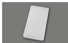
> Weblink 40.001.277.00 / CHF 151.- Schneidebrett, aus Kunststoff