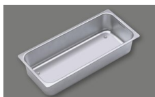
> Weblink 40.001.289.00 / CHF 106.- Resteschale, ungelocht