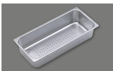
> Weblink 40.000.912.00 / CHF 106.- Resteschale, gelocht