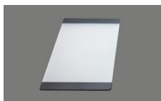
> Weblink 40.000.909.00 / CHF 151.- Schneidebrett, aus Glas, weiss