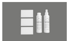
> Weblink 40.001.509.00 / CHF 29.- Reinigungsset Easy Care für Granitspülen