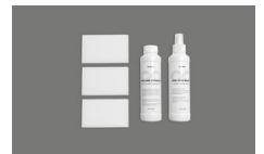
> Weblink 40.001.509.00 / CHF 29.- Reinigungsset Easy Care für Granitspülen