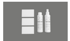
> Weblink 40.001.509.00 / CHF 29.- Reinigungsset Easy Care für Granitspülen