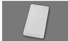
> Weblink 40.001.277.00 / CHF 151.- Schneidebrett, aus Kunststoff