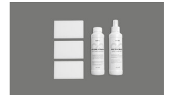
> Weblink 40.001.509.00 / CHF 29.- Reinigungsset Easy Care für Granitspülen