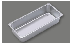
> Weblink 40.001.289.00 / CHF 106.- Resteschale, ungelocht