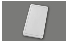
> Weblink 40.001.277.00 / CHF 151.- Schneidebrett, aus Kunststoff