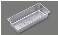
> Weblink 40.000.912.00 / CHF 106.- Resteschale, gelocht