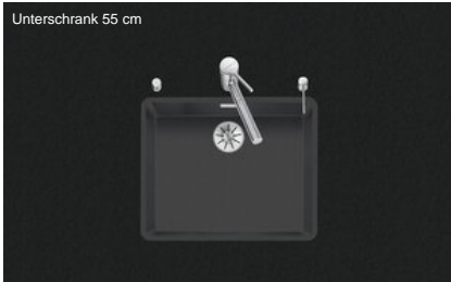
Unterschrank 55 cm

Einbauart Flächenbündige-Spüle Modell LIO CD 50F/17 Material Cristadur Artikel Nr. 10.105.678.00