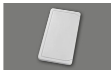
> Weblink 40.001.277.00 / CHF 151.- Schneidebrett, aus Kunststoff