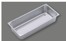
> Weblink 40.001.289.00 / CHF 106.- Resteschale, ungelocht