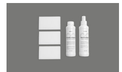
> Weblink 40.001.509.00 / CHF 29.- Reinigungsset Easy Care für Granitspülen