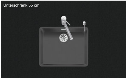
Unterschrank 55 cm

Einbauart Flächenbündige-Spüle Modell LIO CD 50F/17 Material Cristadur Artikel Nr. 10.105.687.00