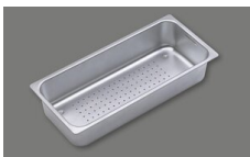
> Weblink 40.000.912.00 / CHF 106.- Resteschale, gelocht