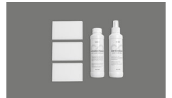
> Weblink 40.001.509.00 / CHF 29.- Reinigungsset Easy Care für Granitspülen