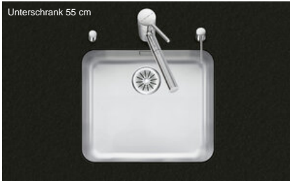
Unterschrank 55 cm

Einbauart Unterbau-Becken Modell SIS 50U Material Edelstahl 18/10 Artikel Nr. 10.102.812.00