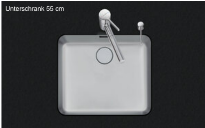
Unterschrank 55 cm

Einbauart Unterbau-Becken Modell V 50-42U Material Edelstahl 18/10 Artikel Nr. 10.105.268.00