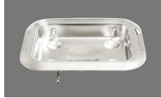
> Weblink 500.000.116.00 / CHF 123.- Garbehälter