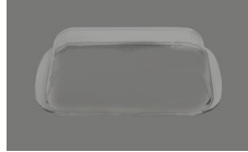
> Weblink 500.000.117.00 / CHF 117.- Glasschale (Deckel für Garbehälter)