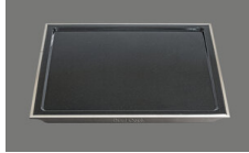
> Weblink 500.000.114.00 / CHF 135.- Garraumteiler