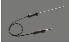
> Weblink 500.000.048.00 / CHF 93.- Kerntemperaturfühler