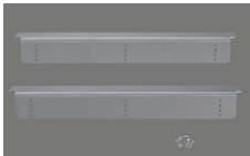
> Weblink 500.000.074.00 / CHF 60.- Auflagewinkel-Set