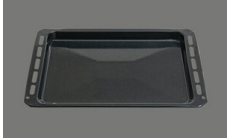
> Weblink 500.000.112.00 / CHF 82.- Universablech 30 mm