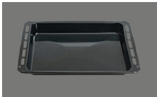
> Weblink 500.000.115.00 / CHF 96.- Extra tiefes Blech 50 mm